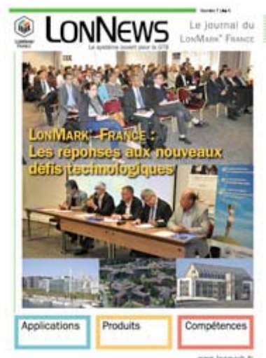
Magazine LonNews 7 – Été 2014

Le tirage du journal est de 4000 exemplaires minimum. Son format est au standard A4. Sa périodicité est de 1 numéro par an. Sa distribution est principalement en France et pays francophones. Le journal comprend entre 24 et 32 pages. Il est diffusé automatiquement à plus de 3000 contacts.